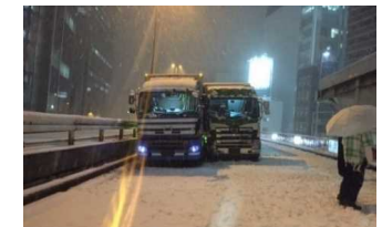
首都高3号渋谷線の状況 <平成30年1月22日 20時頃>