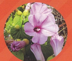
オオバハマアサガオ