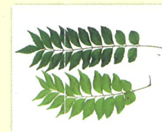
オオバゲッキツ （カレーリーフ）の生茎葉