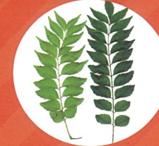
オオバゲッキツ (苗・枝・葉) (カレーリーフ)