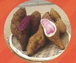
サツマイモ (生茎葉を含む)