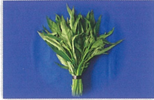
エンサイ(空心菜・ウンチェーバー) の生茎葉