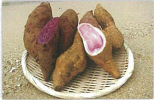
サツマイモ（紅イモなど） の生塊根