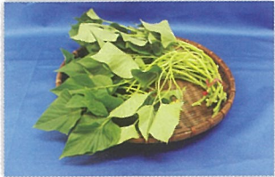
サツマイモ（紅イモなど） の生茎葉