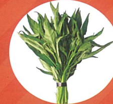
エンサイ (ヨウサイ・空芯菜)

沖縄県 奄美群島 トカラ列島 小笠原諸島の 一部地域から サツマイモ、エンサイ、カンキツ苗木 などの植物の 持ち出しが規制 されています。