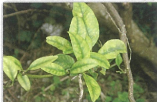
カンキツグリーンング病菌 (病気の症状)