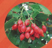
ゲッキツ (苗・枝・葉)