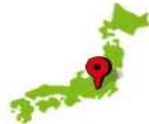
どこを運行しているか